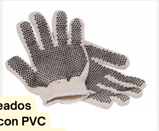
Moteados Palma con PVC antideslizante, tejido algodon