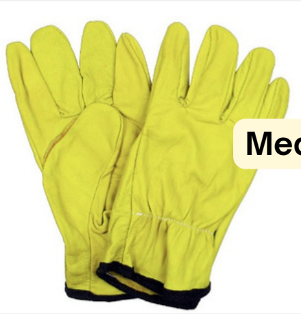
Medio Paseo Vaqueta