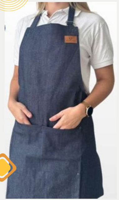
Delantal tela de Jean